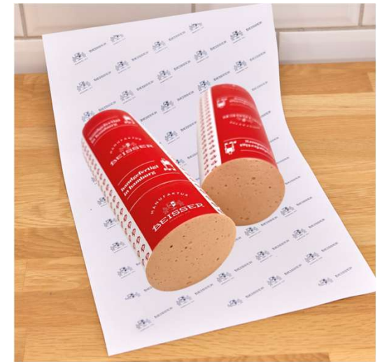
372-401 BEISSER'S GEFLÜGEL FLEISCHWURST 1A CA. 800G / STANGE