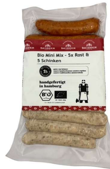
291-105 BIO MINI MIX JE 5x SCHINKEN- & ROSTBRATWURST (SCHWEIN) 10x 25g / 250g