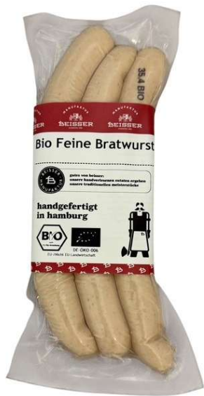
291-101 BIO FEINE BRATWURST (SCHWEIN) 3x 80g / 240g

seit 1836 in 6. generation familiengeführt, steht beisser seit über 188 jahren für beste qualität, handgefertigt in hamburg.