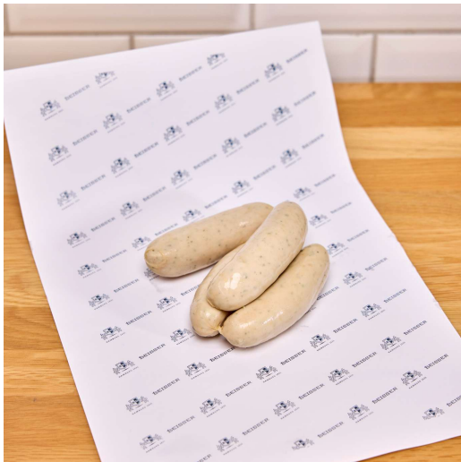
331-301 BEISSER'S WEIßWURST IN LAKE 10x 60G / 600G

in den 90er jahren wurde unsere weißwurst zu einer der besten weißwürste deutschlands gewählt. genießen wie in bayern.