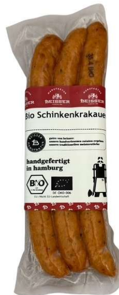
291-104 BIO SCHINKENKRAKAUER (SCHWEIN) 3x 80g / 240g