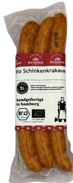
291-104 BIO SCHINKENKRKAUER (SCHWEIN) 3x 80g / 240g