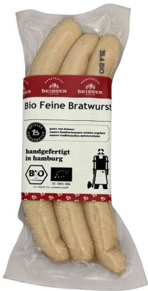
291-101 BIO FEINE BRATWURST (SCHWEIN) 3x 80g / 240g

seit 1836 in 6. generation familiengeführt, steht beisser seit über 188 jahren für beste qualität, handgefertigt in hamburg.