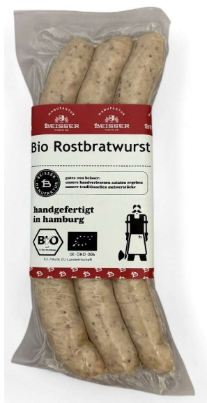
291-103 BIO ROSTBRATWURST (SCHWEIN) 3x 80g / 240g