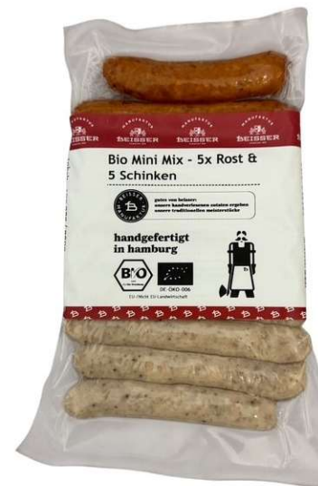
291-105 BIO MINI MIX JE 5x SCHINKEN- & ROSTBRATWURST (SCHWEIN) 10x 25g / 250g