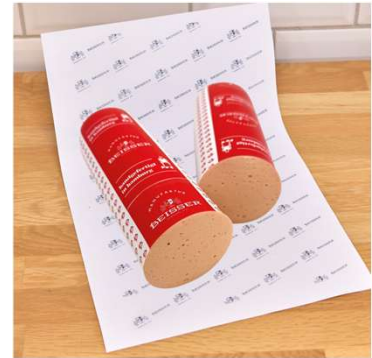
Bestseller 372-401 Beisser's Geflügel Fleischwurst Stange ca. 800g