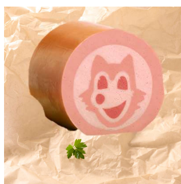
Bestseller 411-539 Happy Fox Brühwurst