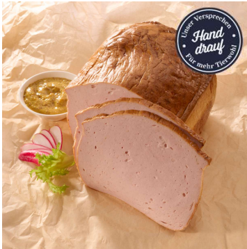
371-110 Fleischkäse fein, 2,0kg