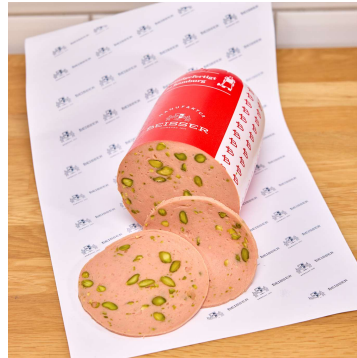
Bestseller 372-110 Beisser's Delikatess Mortadella mit viel Pistazien Schwein/Rind ca. 1,6kg