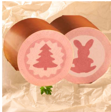
411-537 Happy Christmas (nur Dez) Brühwurst 411-536 Happy Bunny (Mrz/Apr) Brühwurst