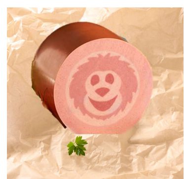
411-540 Happy Monkey Brühwurst