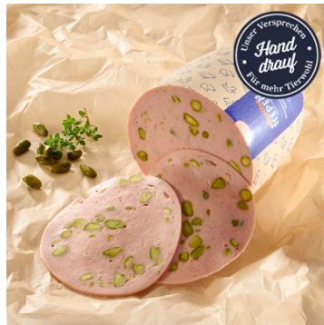
★★★★ Bestseller 372-110 Delikatess Mortadella mit viel Pistazien Schwein/Rind ca. 1,6kg