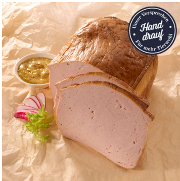
371-110 Fleischkäse fein, 2,0kg