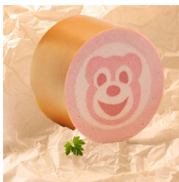
★★★★ Bestseller 411-538 Happy Bear Brühwurst