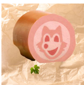
★★★★ Bestseller 411-539 Happy Fox Brühwurst