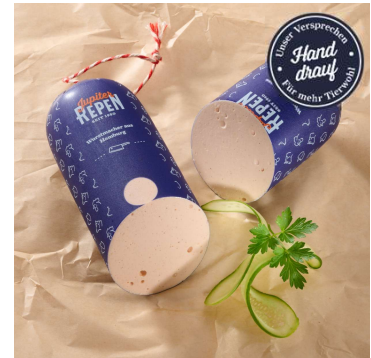
★★★★ Bestseller 372-401 Gourmet Geflügel Fleischwurst Stange ca. 800g