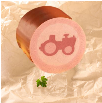
★★★★ Bestseller 411-535 Happy Traktor Brühwurst